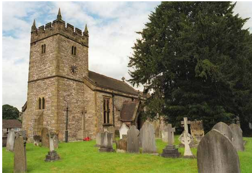
St Mary the Virgin kerk