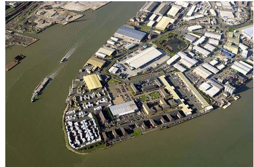
.....naar het moderne industrie terrein van Ashford.

kwaliteit chroom, antiek koper en antiek messing kunnen vervaardigen die voldoet aan de Duncan norm. Deze investeringen hadden tot gevolg dat de productiecapaciteit groeide. Aangezien er bijzonder veel handwerk bij de productie van deze kranen komt kijken, werken inmiddels verschillende familieleden mee in het atelier van The Rye Brothers.