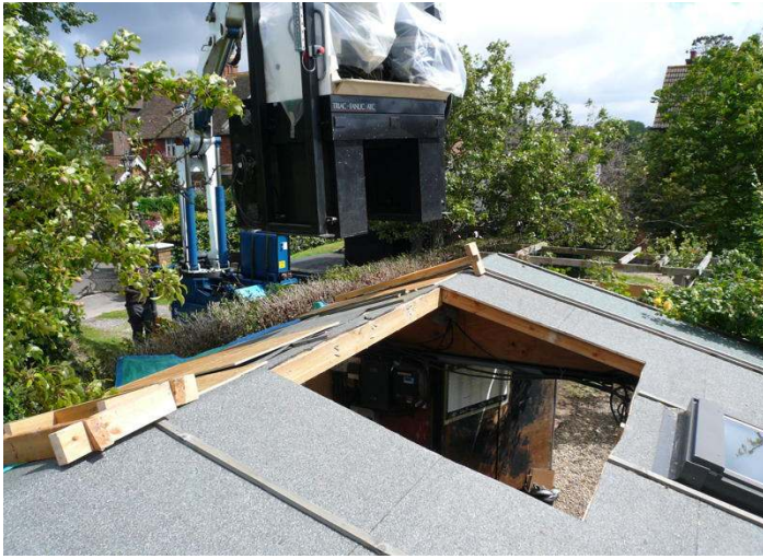
De verhuizing vanuit de oude schuur.....

De schuur werd verruild voor een modern atelier en er werden kostbare productiemachines aangeschaft om niet meer afhankelijk te moeten zijn van toeleveranciers.