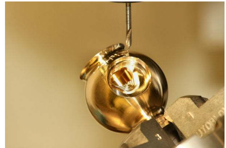
Detail bewerking van een Buckingham Major kraan

Meer info over het bedrijf van The Rye Brothers vindt u op : http://www.brassproducts.co.uk/