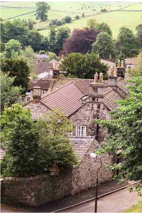
"The Rookery" idylisch Ashford