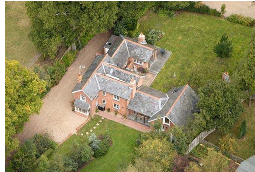
Het ouderlijk huis van Duncan en Simon Rye met werkplaats